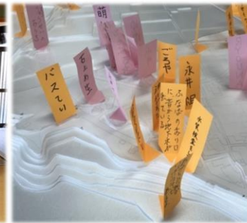
(思い出の場所に旗を立てた)