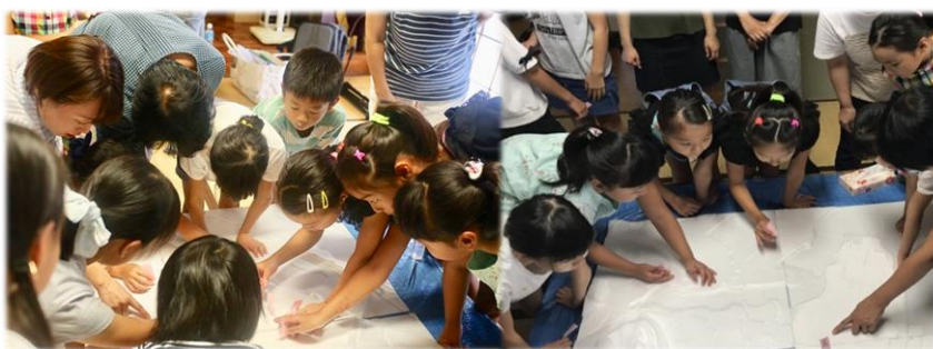
(自分の住んでいる家の場所を探している様子)