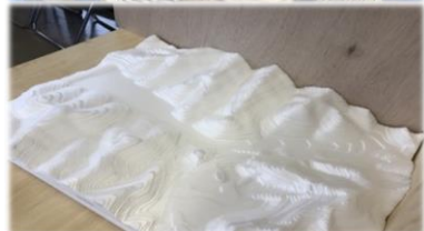
(立体模型を作製している様子)