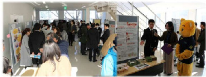
(パネル展示交流会)