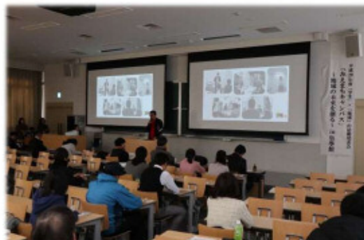
(全体会:決勝プレゼン)