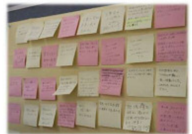
(参加者からのコメント)