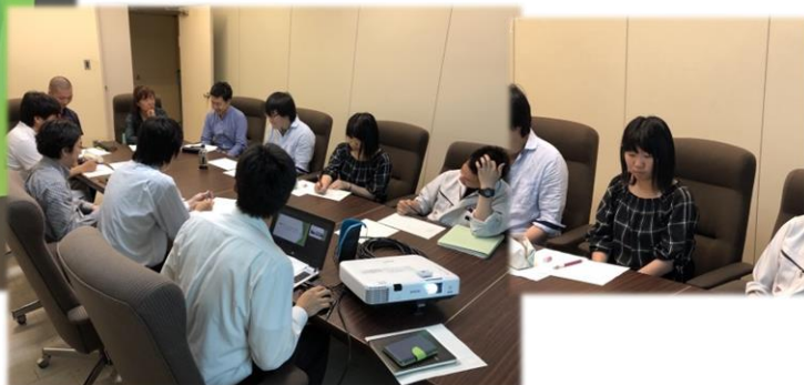
全体会打ち合わせ (5月31日)